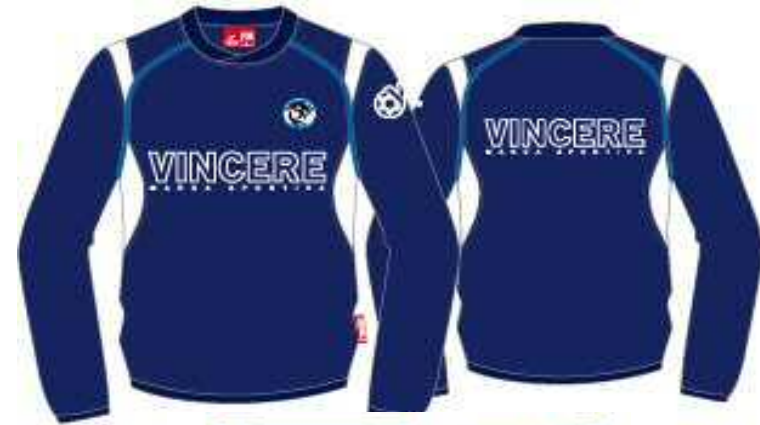
ヒ°ステトップ° (ネヒバー)