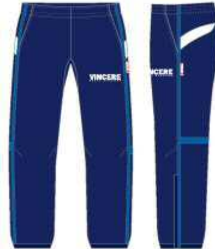
ヒ°ステボトム (ネヒバー)