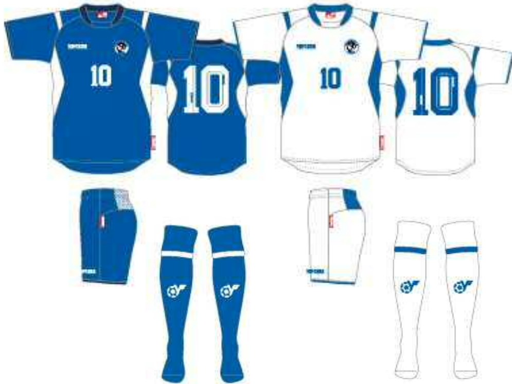
半袖プラクティスシャツ (ブルー) プラクティスパンツ (ブルー) ソックス (ブルー)