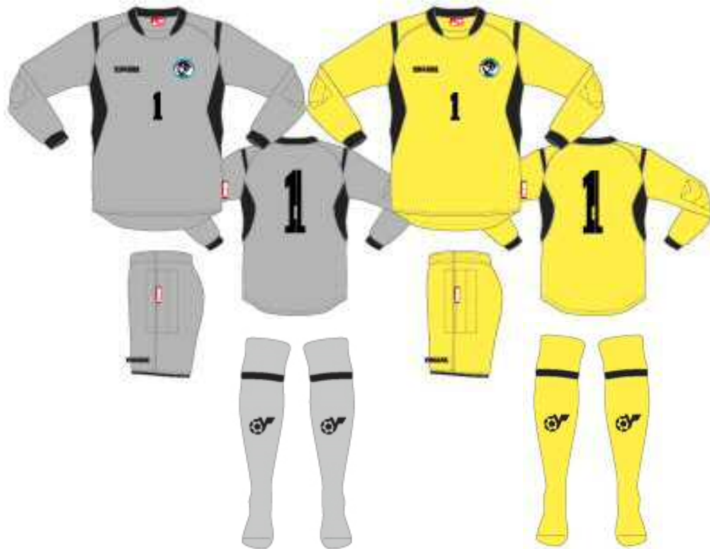
GKフ拉克ティスシャツ (グレー) GKフ拉克ティスパンツ (グレー) GKストッキング (グレー)