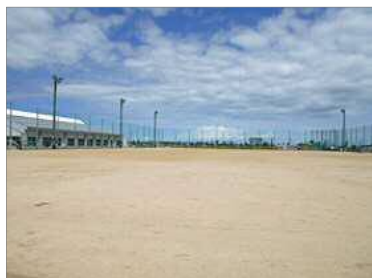
主に多目的グラウンド（クレー）で行います。