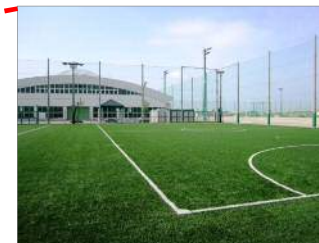
屋外フットサルコート（人工芝）も使用します。