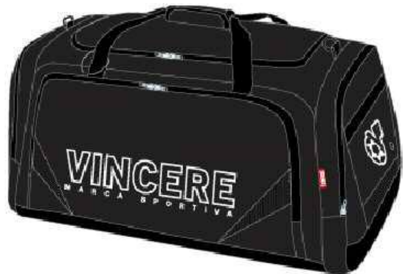
遠征バッグ (ブラック)