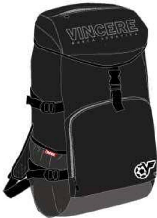
バックパック (ブラック)