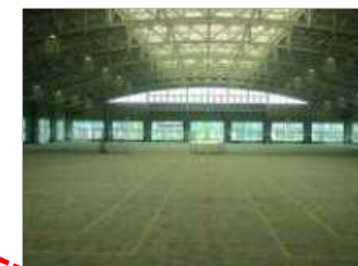
雨天・冬季は屋内コートで。