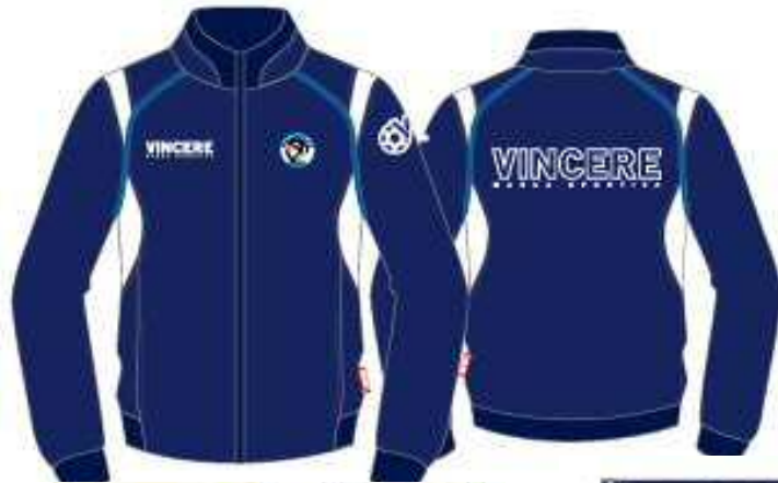
ウォームアップ°トップ° (ネヒバー)